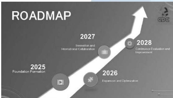
Gambar. 2 Roadmap UPT Pengembangan Karir

Roadmap ini tidak hanya menjadi alat navigasi, tetapi juga representasi dari komitmen kami untuk memberdayakan individu melalui pendekatan yang holistik dan berkelanjutan. Dengan fokus pada peningkatan kapasitas, keterampilan, serta jaringan profesional, kami berupaya menciptakan ekosistem yang mendukung pertumbuhan karir secara menyeluruh. Mulai dari pembekalan soft skills dan hard skills, pelatihan kepemimpinan, hingga penyediaan akses ke pasar kerja yang relevan, setiap elemen dalam roadmap ini dirancang untuk menjawab kebutuhan nyata di lapangan